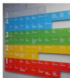
Рис. 3. Визуализация