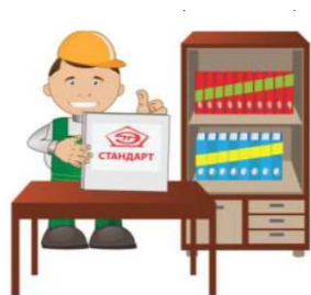
Рис. 1. Стандартизация