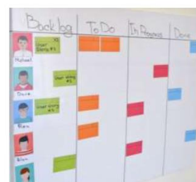
Рис. 4. Доска задач «Канбан»