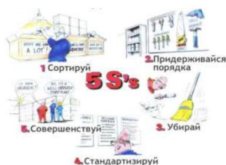
Рис. 2. Принцип организации рабочего пространства (5S)